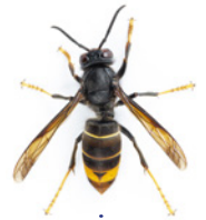
Frelon asiatique ( Vespa velutina )