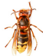
Frelon européen ( Vespa crabro )