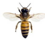
Abeille domestique ( Apis mellifera )